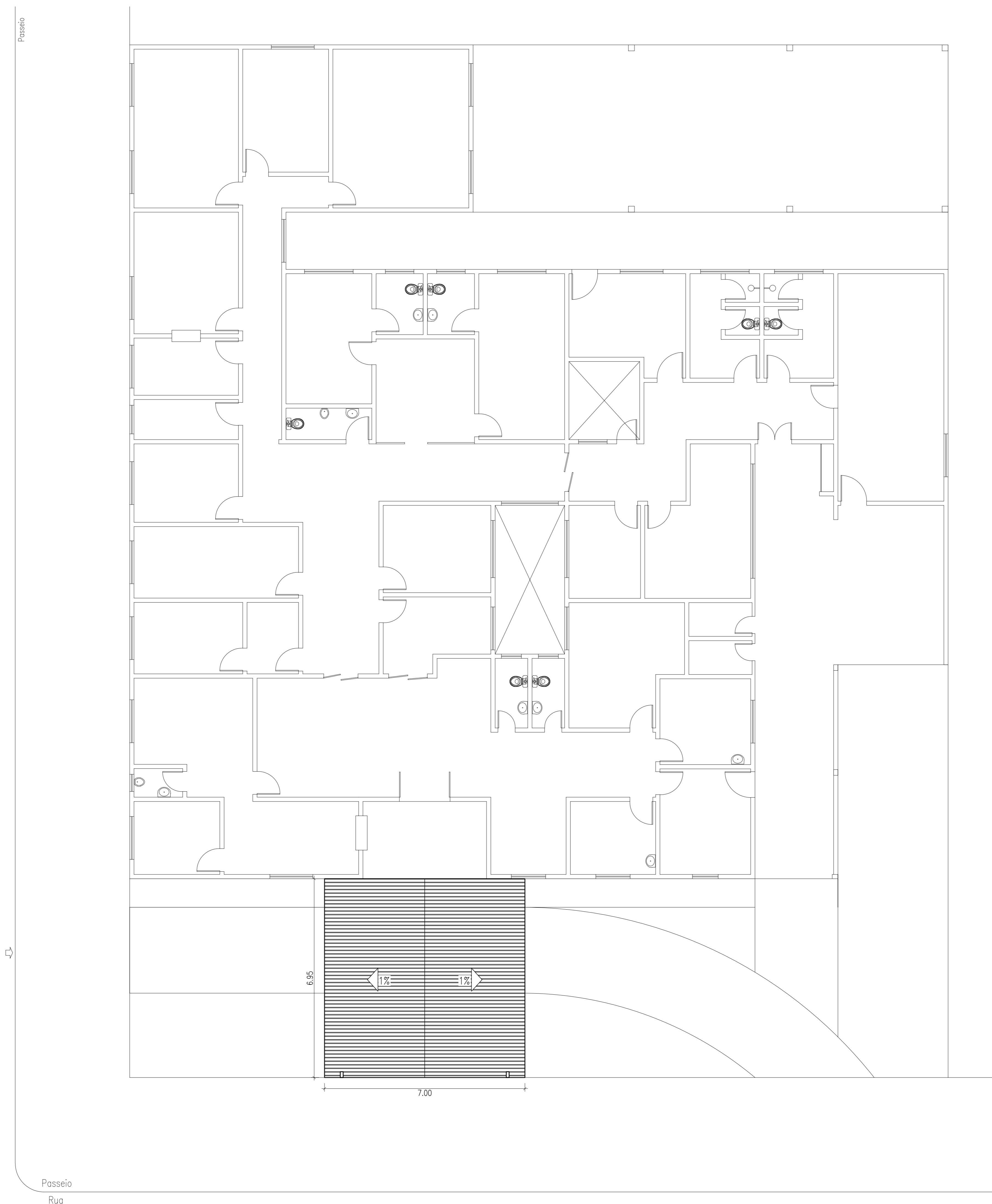
PROJETO LOCAÇÃO COBERTURA FRONTAL ESC.:1:100