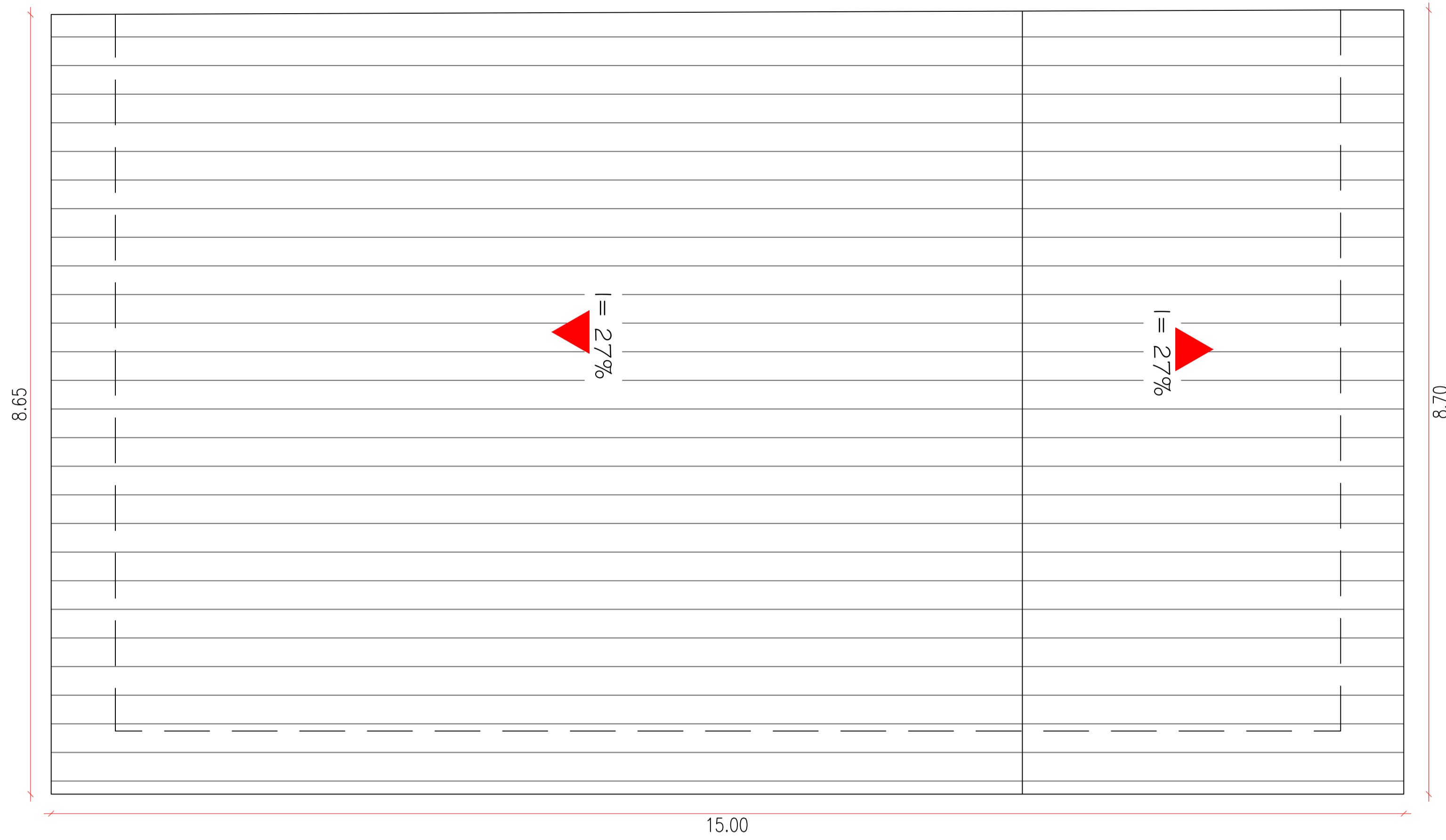
PLANTA BAIXA - Cobertura ESC.: 1/50 Á.: 130,12m 2